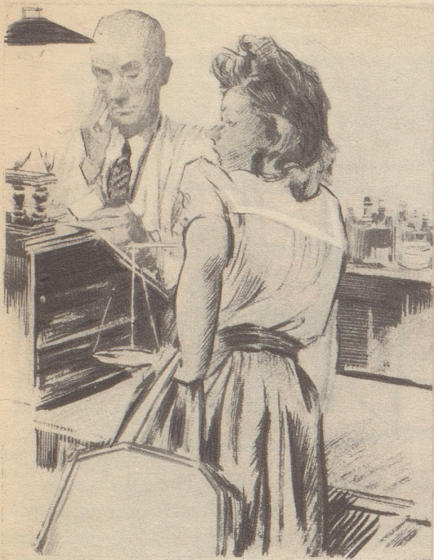
In einer kleinen Apotheke