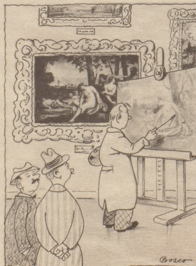
«Was machets ächt mit dem alte Bild wänn s neu fertig ischt?»

(Besonders was die Fräuleins anbelangt, geht mit Spitteler vollkommen einig WS)