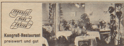
Kongress-Restaurant preiswert und gut