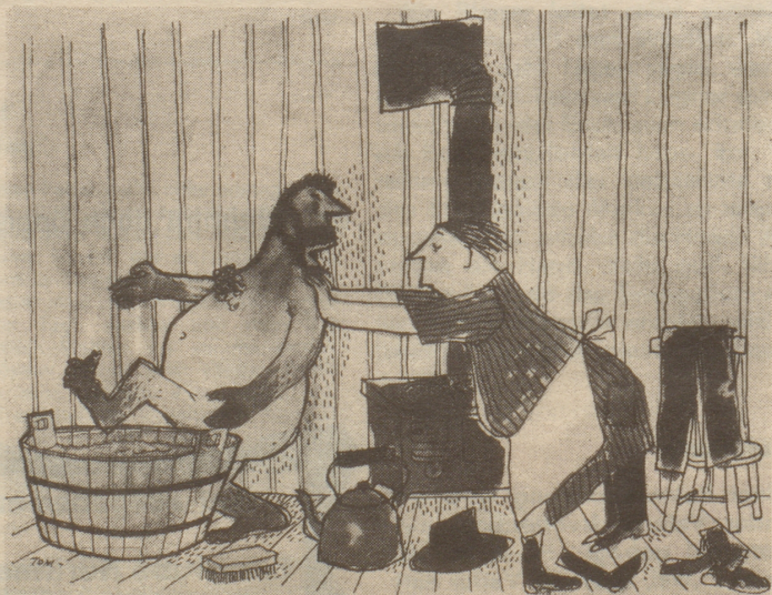
Wieder ist ein Jahr vergangen!