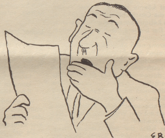
und wieder eine.