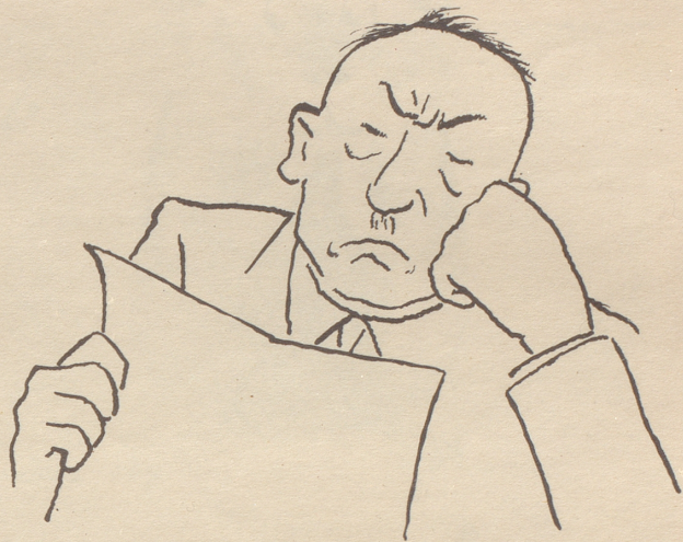
Die zweite Atombombe zur Explosion gebracht!!