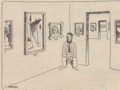
Der Künstler stellt aus. Tyrhans