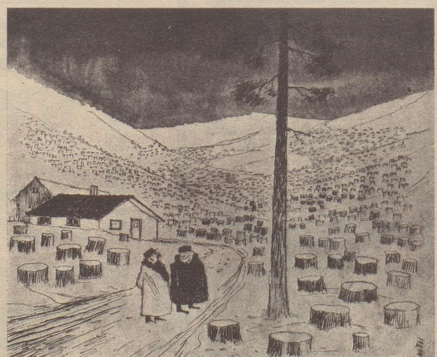
„Meine Frau will, daß dieser Baum stehen bleibt. Sie ist so empfindsam für die Natur.“ Söndagsnisse Strix