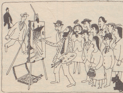
Der Künstler malt —