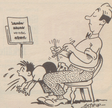
Basler straft seinen Sohn

Wahrhaftig! Das wäre ja noch schöner. Frauen im Stimmlokal und gar noch als aktive Bürgerinnen. Nein, die gehören an den häuslichen Herd, allwo sie zu warten haben, bis der Nachfahre derer von Morgarten sich von seinen Stammtischgenossen und der dazu gehörigen Kellnerin losgerissen hat, nachdem er seine vaterländische Tat genügend besprochen und begossen hat. Und überhaupt: wir sind dem «schwachen Geschlecht» punkto Gleichberechtigung schon viel zu weit entgegengekommen. Nicht genug damit, daß unsere Frauen den Lebensunterhalt der Familie mitverdienen helfen, lassen wir es auch noch zu, daß sie auf dem Weg zur Arbeit im Tram und Autobus die ganze Strecke stehen dürfen. Nein, die große Politik muß Männersache bleiben, denn nur den Männern steht es zu, sich das Recht zur Selbstbestimmung und die Handlungsfreiheit durch immer neue Gesetze vom Staate abnehmen zu lassen. Und nur der politisch klar und nüchtern denkende Mann ist in der Lage, sein wuchtiges JA oder vernichtendes NEIN so in die Urne zu werfen, wie es seine Partei oder sein Verband für richtig halten. Frauen aber wären dabei ganz unbrauchbar. Sie könnten ja eine eigene Meinung haben, die weder mit derjenigen ihres Herrn und Gebieters noch mit einer Parteimeinung übereinstimmen würde. — Wo kämen wir denn da hin? Weißt Du