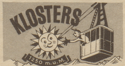
Kur- und Verkehrsverein Klosters, Tel. (083) 3 84 40