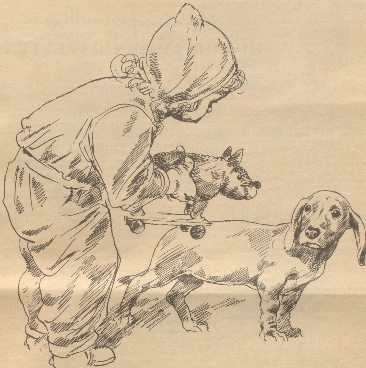
Zeichnung von Robert Högfelddt

Fingern um und um. Ich pirsche mich von ihm weg, wie man vor einem Wohlfäter davonschleicht.