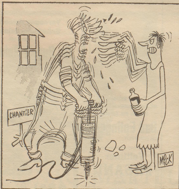
«Arbeit, nichts als Arbeit. Nicht einmal Zeit für deine Medizin hast du.» France Dimanche