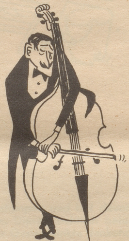
CHOPIN (Valse triste)