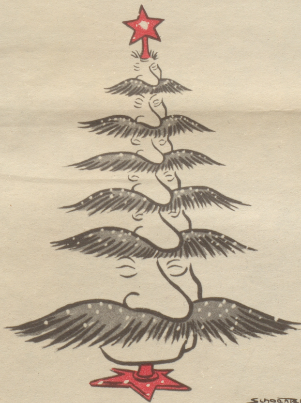
Weihnachtsbaum in Ostdeutschland

Der Nebelspalter-Verlag in Rorschach liefert Ihnen die Bücher mit Kassette ohne Aufschlag zu den normalen Preisen.