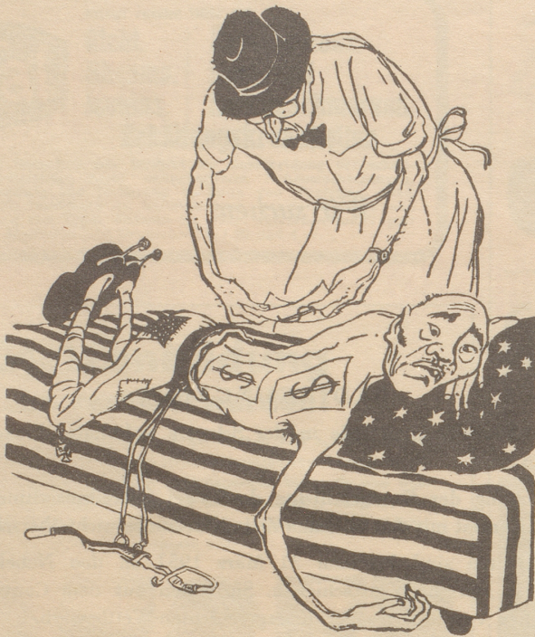
Eine russische Satire über die Fernost-Politik der USA.