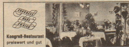
Kongreß-Restaurant preiswert und gut