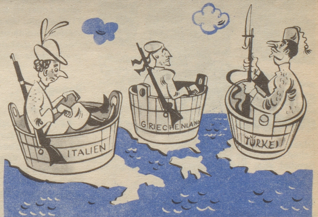
Italien, Griechenland und die Türkei, Mitglieder des Atlantikpaktes

E chli öppis vom Atlantik wei mir de glich no um üs ume!