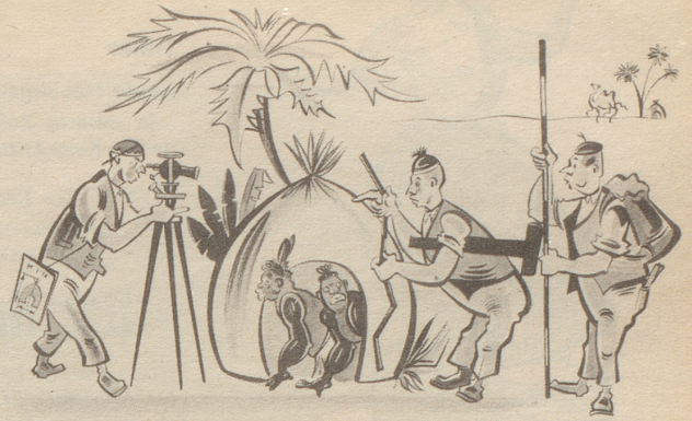
Der Ruf nach billigen Wohnungen.

„O, derangieret ech nid, mir möchte nume s Problem vom billige Huusbau schtudiere!“