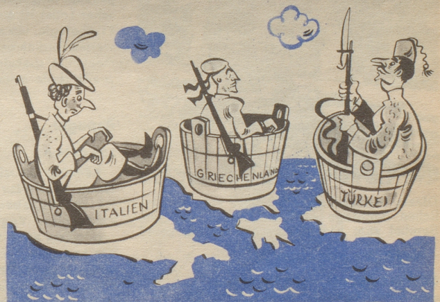
Italien, Griechenland und die Türkei, Mitglieder des Atlantikpaktes

E chli öppis vom Atlantik wei mir de glich no um üs ume!