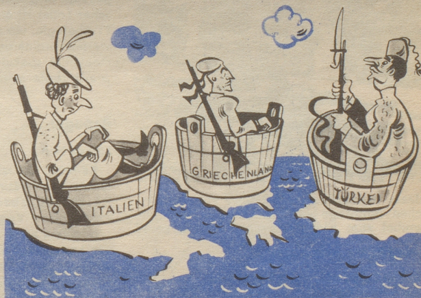
Italien, Griechenland und die Türkei, Mitglieder des Atlantikpaktes

E chli öppis vom Atlantik wei mir de glich no um üs ume!