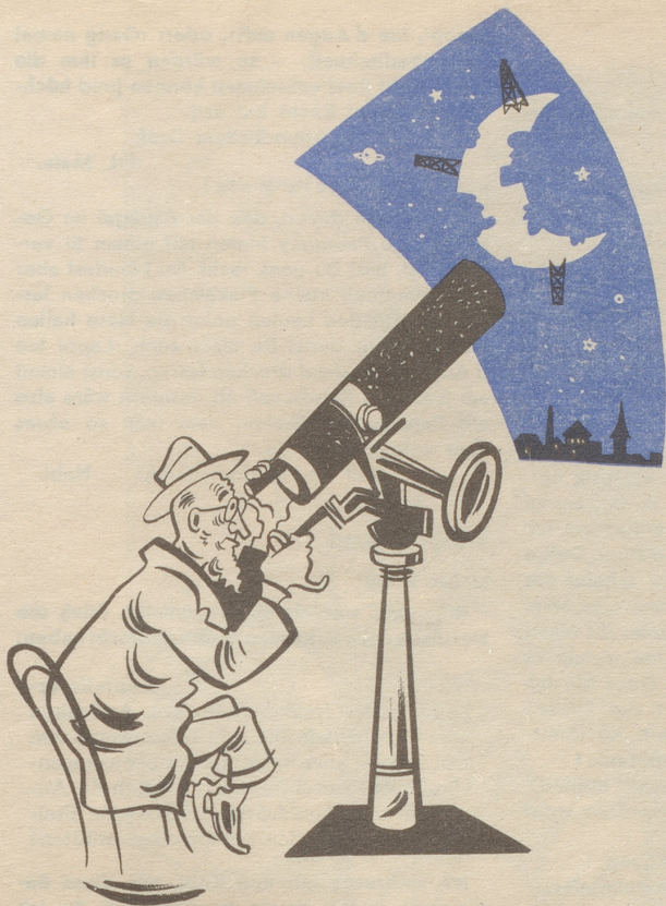
Zukunftsgläubige sehen im Mond ein riesiges Rohstoffreservoir für unsere Erde Was machen sie aus unserem schönen alten Mond?!