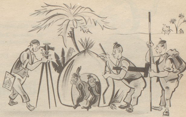
Der Ruf nach billigen Wohnungen.

„O, derangieret ech nid, mir möchte nume s Problem vom billige Huusbau schtudiere!“