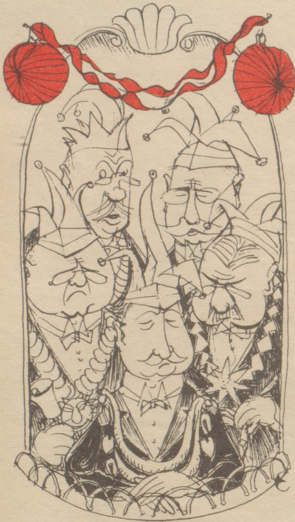
Fasnacht bi Eus Sinnentaumel isch e chli vill gsait!