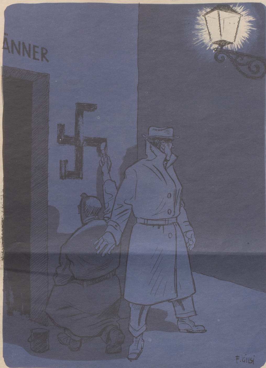
Am Steinenring zu Basel, an einem Ort, der mit «Männer» angeschrieben ist, wurde nächtlicherweise ein großes Hakenkreuz aufgemalt.