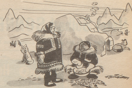
„Mich nimmt wunder, was für eine Figur ich habe.“ Journal

Wenn also Leonore auf Lebzeiten versorgt sein will, soll sie meine ehemalige Helvetia anstellen. Leonore kommt dann auch nicht aus der Übung, denn sie muß die halbe Arbeit selber machen. Sie ist