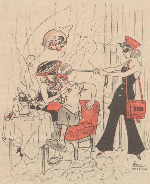
„Salü du ich bi dr Esbebe-Ufschlag!“