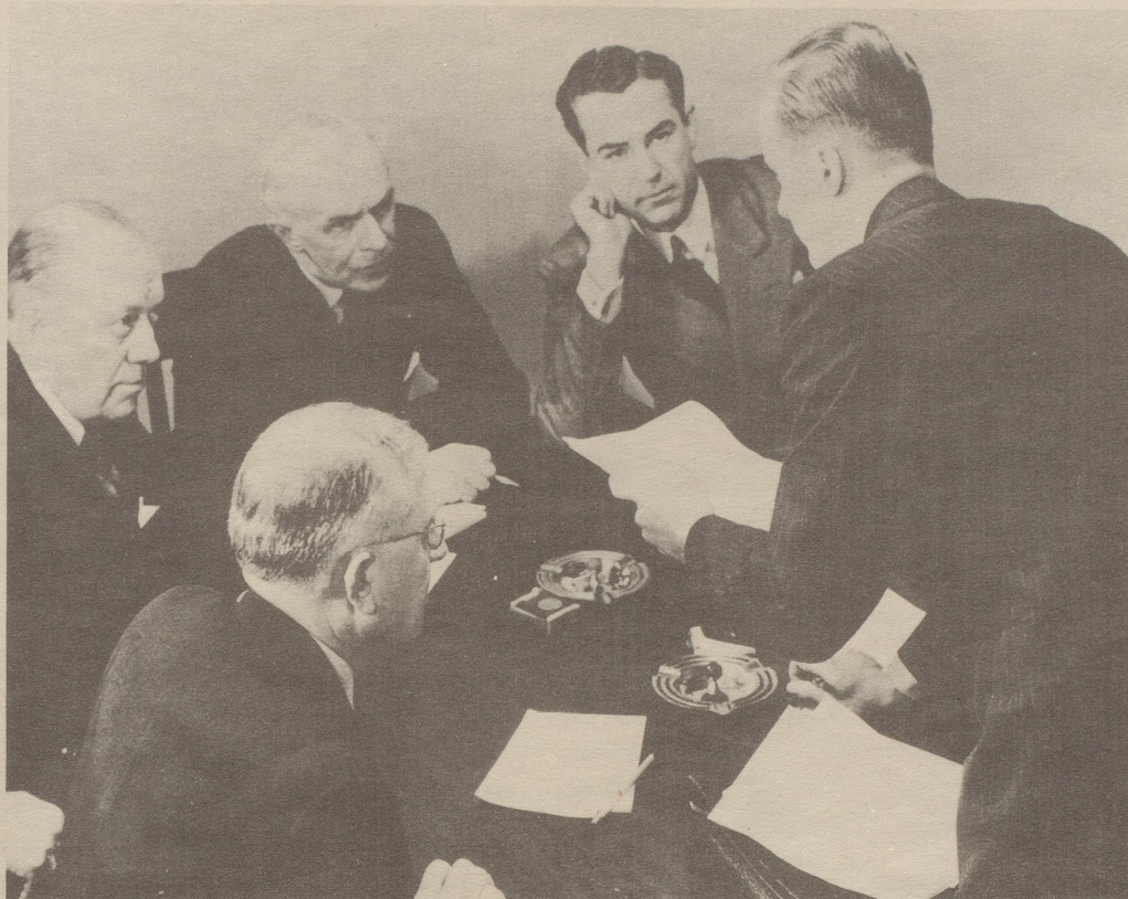
Der Präsident, Hr. Dr. Frey und die anderen Herren der Aufsichtskommission wissen: Rasierte Haut braucht Pitralon. Welche Wohltat ist Pitralon nach dem Rasieren. Pickel und Mitesser verschwinden.

Alle tadellos rasierte Herren verwenden nach dem Rasieren stets Pitralon. Nur so wird die Haut elastisch und widerstandsfähig. Pitralon erfrischt die Haut. Das lästige Gefühl gespannter Haut verschwindet.