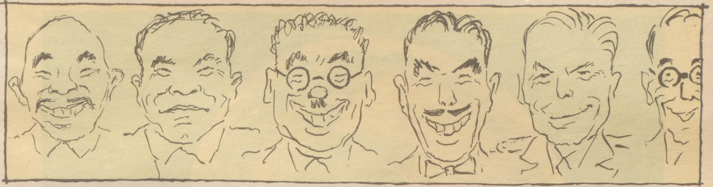
Die Konferenz beginnt wie alle bisherigen Konferenzen,