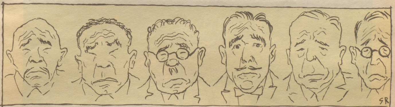
um zu enden wie alle bisherigen Konferenzen