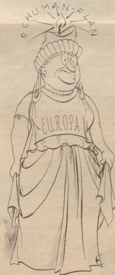
Mütterchen Europa geht ein Licht auf