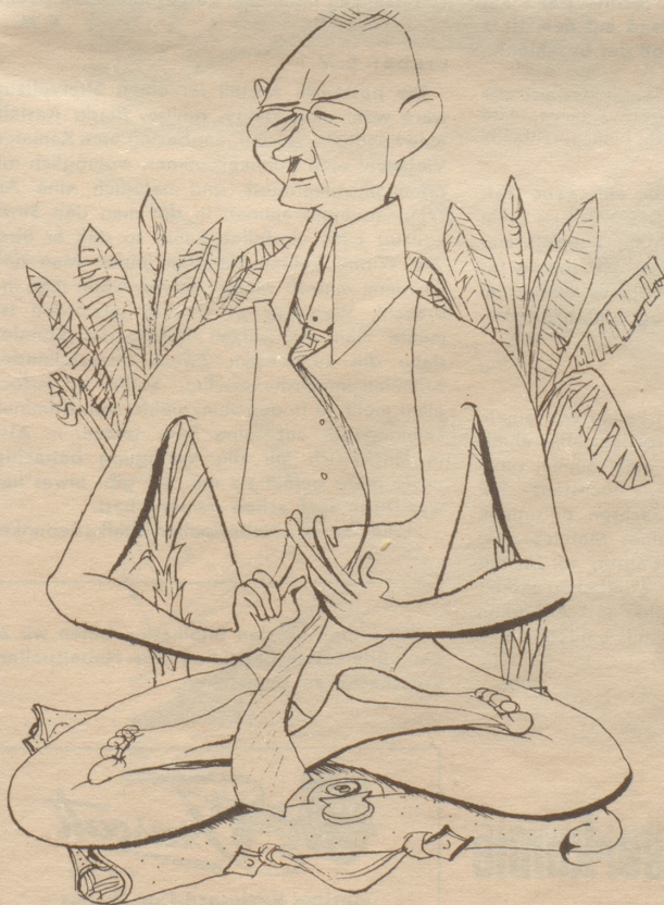
Der anpassungsfähige Schacht ist Finanzberater der indonesischen Regierung

Senkrecht: 1 Ur, 2 Agonie, 3 Sirmach, 4 Schlag-sahne, 5 Boa, 6 el, 7 Bs., 8 der, 9 mir, 10 Elaf, 11 Hafen, 12 Aera, 13 Tag, 14 SO, 15 Bela, 16 tuell, 17 ignorieren, 18 im, 19 stramm, 20 in, 21 Trunk, 22 Damen, 23 Eve, 24 Aas, 25 Dame, 26 Elm, 27 Rebellion, 28 Tadel, 29 Nebel, 30 Titel, 31 nid, 32 und 33 Soirée, 34 Linnen, 35 Braue, 36 Bum, 37 nei.