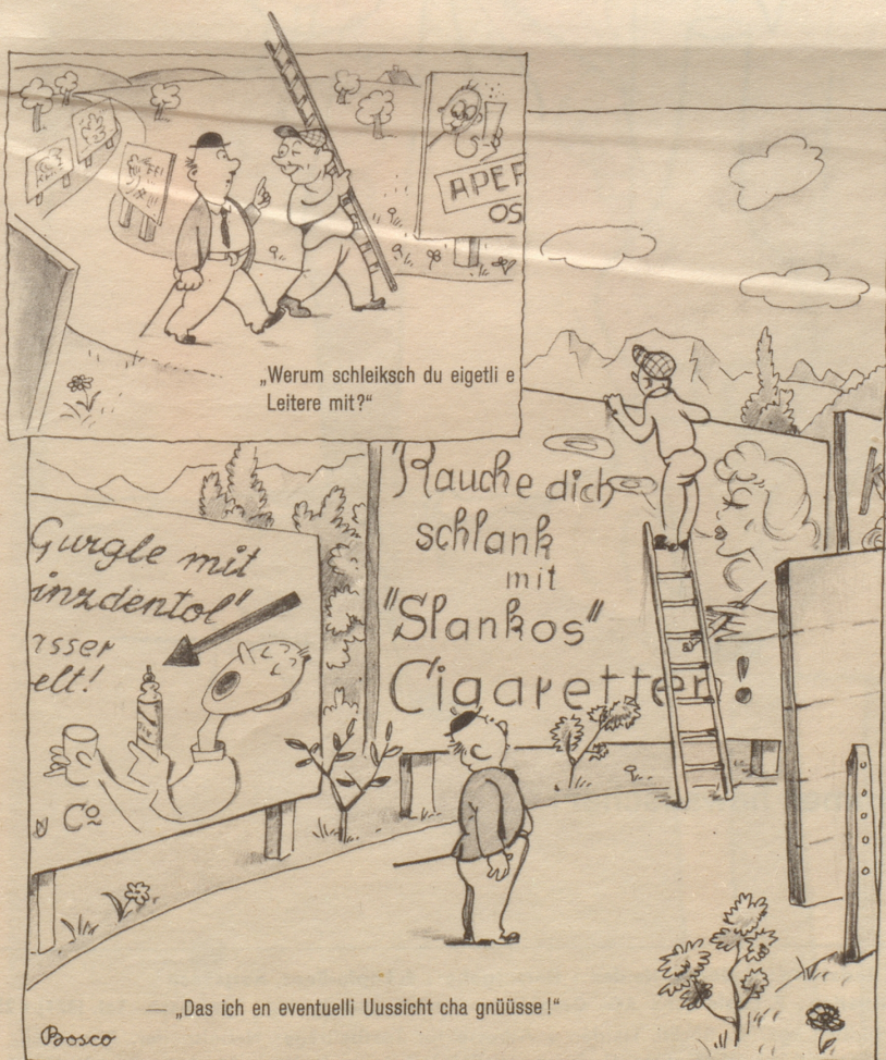
— „Das ich en eventuell Uussicht cha gnüsse!“