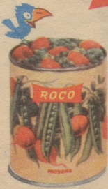
Erbsen mit Carotten fein: die beliebte und gesunde Gemüseplatte.