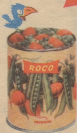
Erbsen mit Carotten fein: die beliebte und gesunde Gemüseplatte.