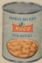
Roco Eier-Ravioli - nicht umsonst die beliebtesten!