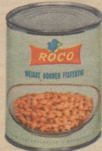
Weisse Bohnen fixfertig: bschüsslig - sättigend - vorteilhaft.