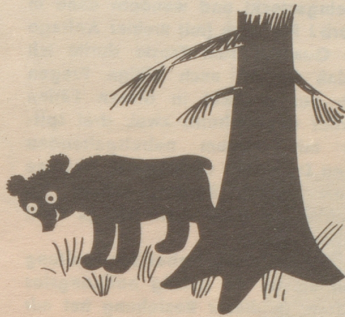
Im Nationalpark ist die J agd, bereits seit Jahren untersagt.