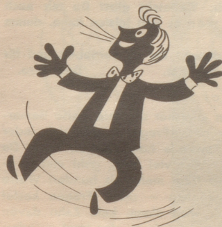
Voll J ubel jauchzt der junge Mann, weil er das grosse Los gewann!