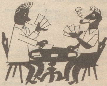
In unserm Land wird unentwegt das J assen jederzeit gepflegt.