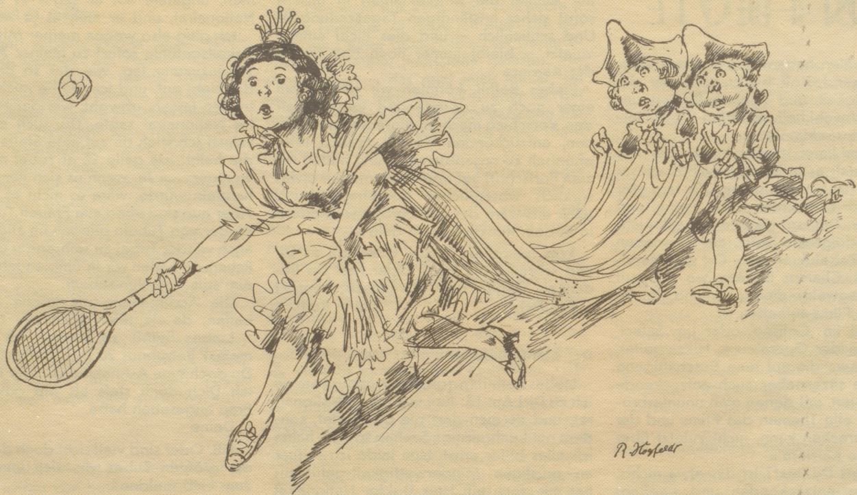
Prinzeßchen geruht zu spielen