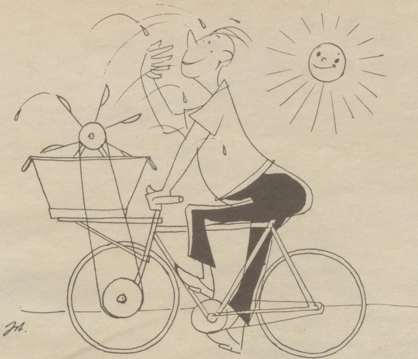
Vorschlag für heiße Tage