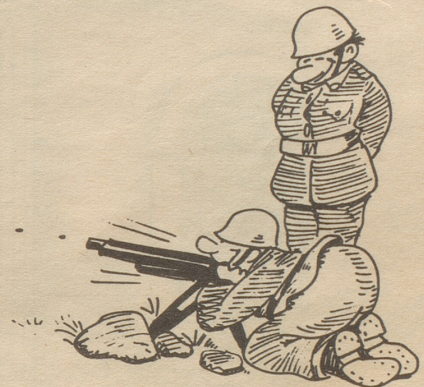
Der Künstler am Maschinengewehr