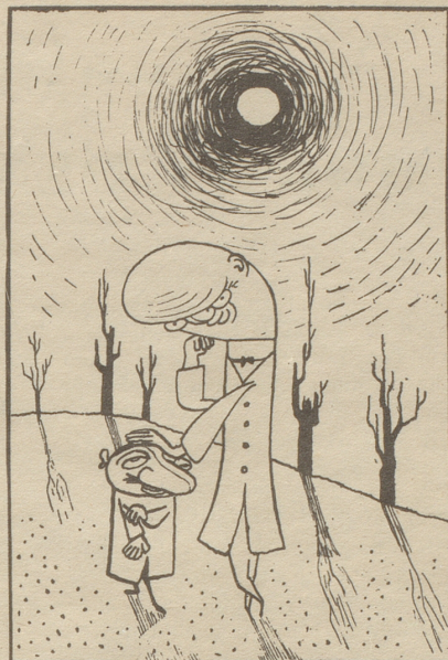
«Sie sitzen auf Nadeln im Sicherheitsrat.» «Ja, aber wenigstens auf Sicherheitsnadeln!» Tyrihans