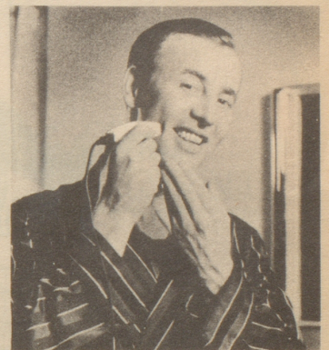
Pitralon für alle Herren, auch für Elektro-Rasierer. Pitralon nach dem Rasieren mit der Hand auftragen.