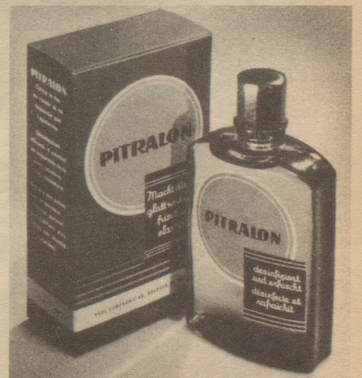
Verlangen Sie auch im Salon von Ihrem Coiffeur nach dem Rasieren regelmäßig Pitralon für Ihre Haut.