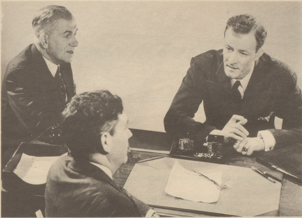
Hr. Dr. Benz und die beiden anderen Herren verwenden nach dem Rasieren Pitralon. Alle drei wissen: Rasierte Haut braucht Pitralon. Pickel, Pusteln verschwinden. Pitralon macht die Haut frisch und elastisch.