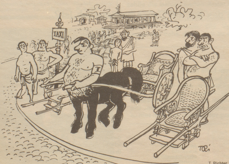
nicht gern gesehen als Konkurrent.