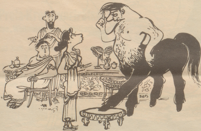
nicht gern gesehen als Kunde,