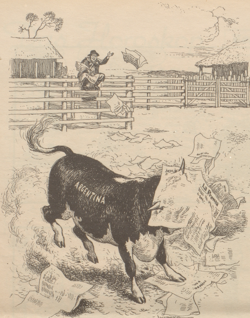
„La Prensa“ war die bedeutendste unabhängige Zeitung Argentiniers