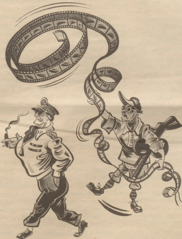
Hollywood versucht, MacArthur als Filmschauspieler zu gewinnen