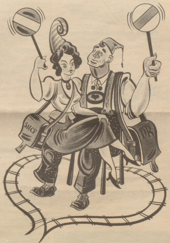
Eisenbahnpool zwischen Frankreich und Deutschland. Das Verhältnis wird ja immer vielversprechender!