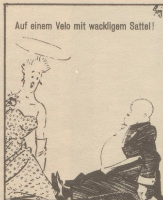
Auf einem Velo mit wackligem Sattel!