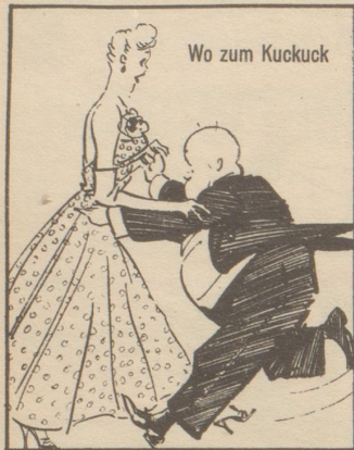
Wo zum Kuckuck