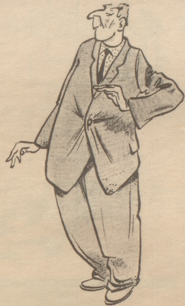
Musisch veranlagter Kleinrentner möchte...