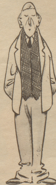
Vom Leben Enttäuschter, wagt noch ein letztes Mal...