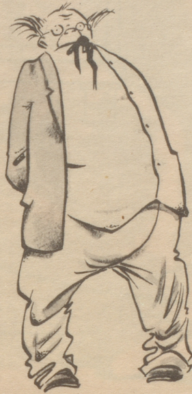
Bin schuldlos geschieden, musikliebend, energisch. Wer wagt es...?