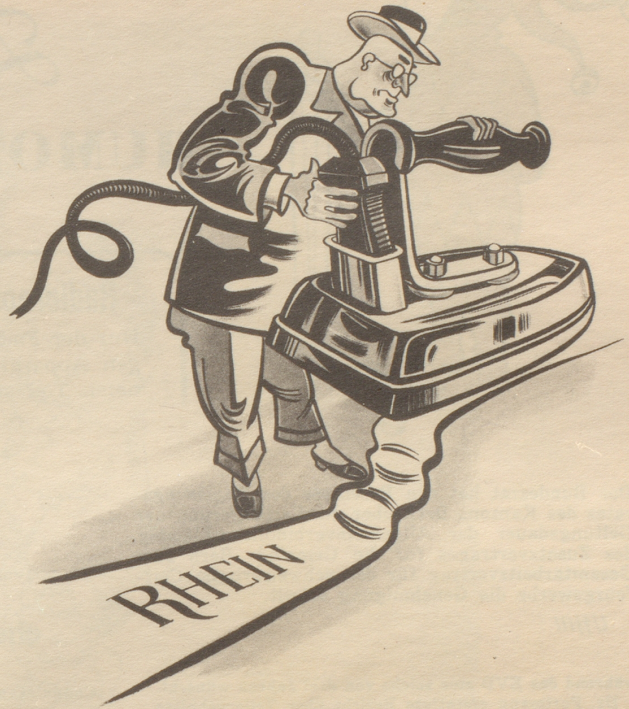
Das geplante Rheinau-Kraftwerk gefährdet unseren einzigartigen Rheinflall

Bitte darfs süsch no öppis sii, z. B. es Sändwitsch, es Bierli, es hübsches Generalabonnemänt, feini Schtümpe . . .