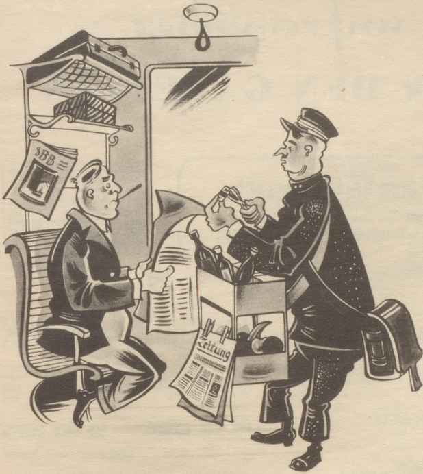
Die SBB verkauft Reiseproviant in den Zügen

Bitte darfs süsch no öppis sii, z. B. es Sändwitsch, es Bierli, es hübsches Generalabonnemänt, feini Schtümpe . . .