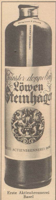
Erste Aktienbrennerei Basel