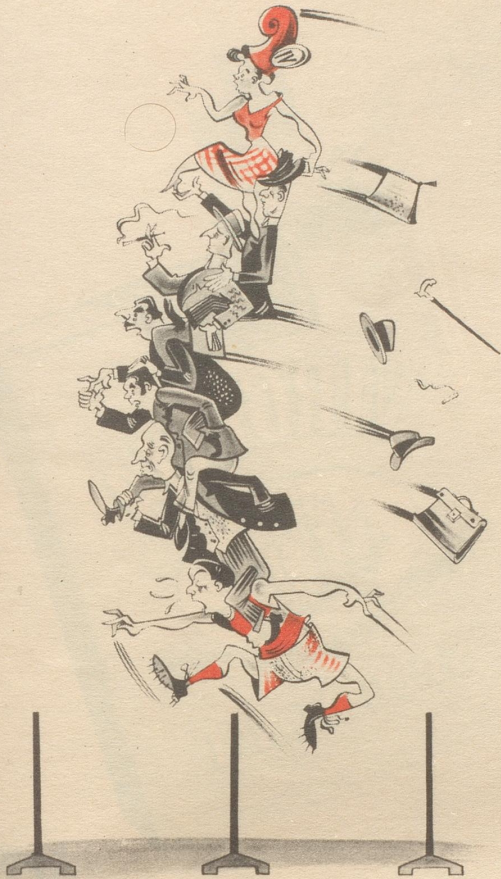
Bisher hat, wenn auch mit großer Mühe, Bidault alle Hindernisse genommen.