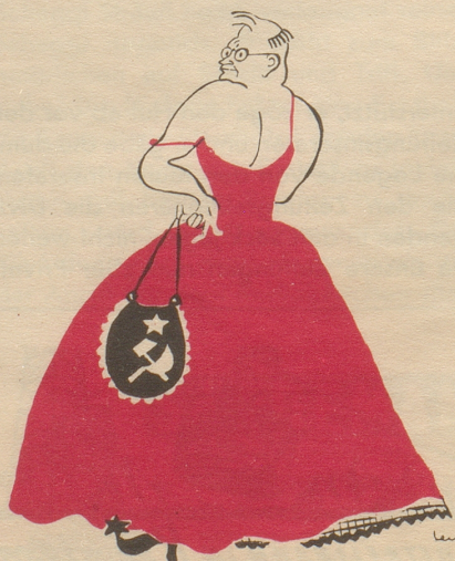
Wyschinskij zeigt die kalte Schulter

In der Maturaklasse liest Käthi vor der Klasse stehend aus einem Buche vor. Anscheinend spricht sie leise, denn viele Mitschüler haben Mühe, sie zu verstehen. Auch dem Lehrer geht es so und darum unterbricht er: «Käthi, lesen Sie doch bitte lauter. Die ganze Klasse hängt an Ihren Lippen!» – Die Knaben lächeln, Käthi wird krebsrot und der Professor weiß nicht, warum ihn alle so dumm anschauen. WSO