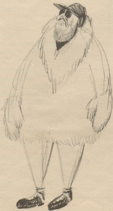
„Was choscht das Kaff?“

An der Portierloge mußte ich warten, denn der Eishockey-Internationale tele-