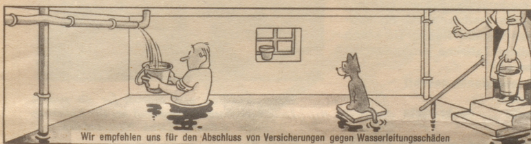
Wir empfehlen uns für den Abschluss von Versicherungen gegen Wasserleitungsschäden

Ein Wort aus Pestalozzis fröhlichem Herzen.