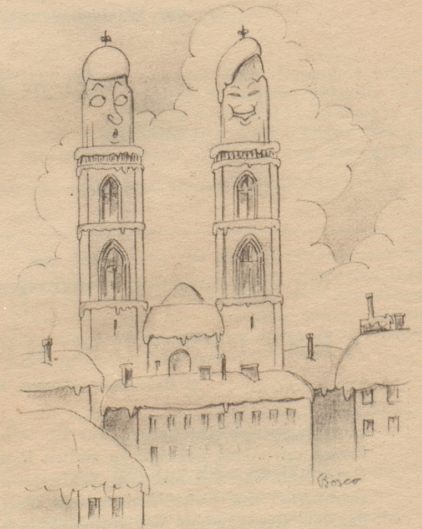
„Wie hät au dä sini Chappe wider uf!“