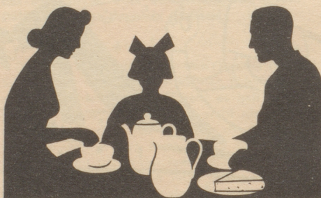
FABRIKANT: WEICHKÄSEREI USTER