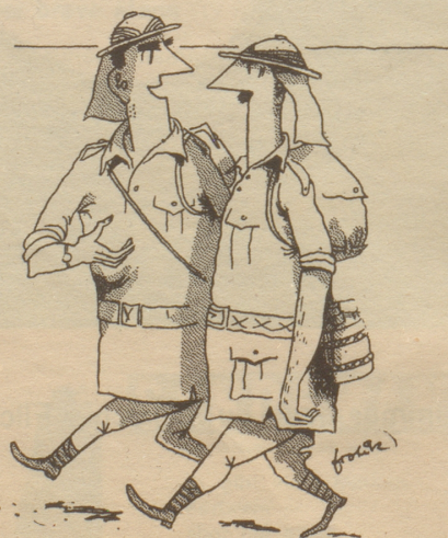
«Es ist ein grausamer Zehn-Tage-Marsch, aber es lohnt sich wegen der wunderbaren Fata Morgana!»

«Du hilfst mir doch», bat Edwin mit Wangen, die vor Eifer glühten, «mache dich wenigstens für ein paar Tage frei und führe mich mit deinem Wagen zur Kundschaft. Wer weiß, vielleicht verkaufen wir den ganzen Posten schon am ersten Tag. Ich zahle dir das Benzin und die Hälfte vom Gewinn. Im Geschäft mache ich natürlich Ferien.»