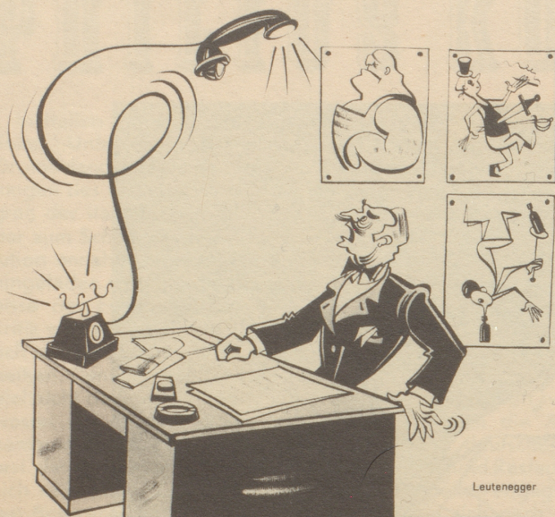
Es scheint wieder der hartnäckige Fakir zu sein, der anlütet!