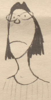
« En Ärmelschurz isch jedefalls s Aschtändigstcht! »

Nachschrift: Von mir nicht bemerkt hat meine Frau den Fragebrief mitgelesen und flüstert mir über die Achsel (mit Trägern!) zu: «Fischbein, Lieber, Fischbeinstäbchen!» — womit obige Anfrage keiner Antwort bedarf.